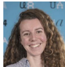
Anaëlle Gérard Santé & SHS